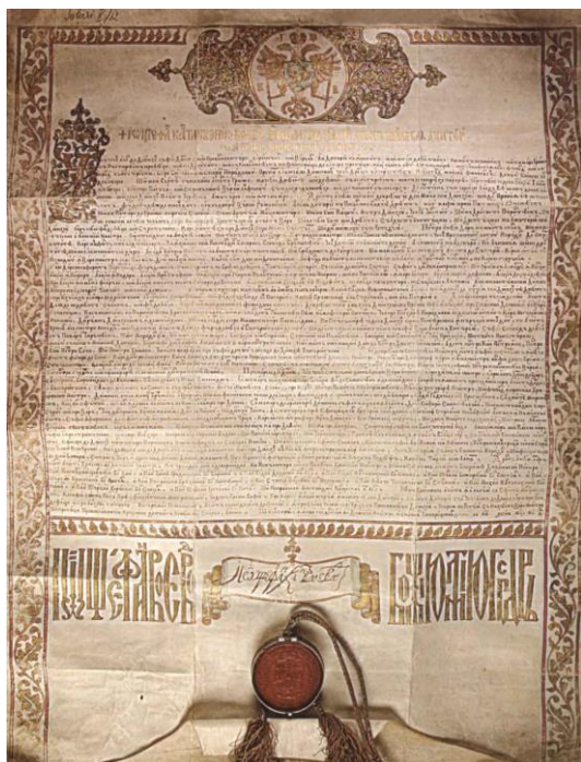
Hrisovul lui Ștefan Cantacuzino pentru desființarea văcăritului

Prelucrarea untului înseamnă pasul ultim al beneficiului deținerii unei cirezi de vite, considerând vita ca fiind materie primă. În cazul mănăstirilor (sau în genere al unui mare proprietar de bovine și ovine) nu este vorba de asigurarea unui mijloc de subzistență ci de comercializarea acestui produs în special peste graniță, în Imperiul otoman. Desigur că se comercializau și ovinele și bovinele pentru carne de către proprietari, piața istanbuliotă în special fiind pentru aceștia un debușeu important 13 . De aici poate, poziția noului domn Ștefan Cantacuzino de a elimina văcăritul dintre birurie vistieriei, bir care afecta cel mai mult pe deținătorii de cirezi și în special mănăstirile 14 – de aici blestemul adus văcăritului și a celor care ar fi îndrăznit să-l reinstituie, citirea în vileag a hrisoavelor de înfierare a văcăritului 15 , cu mare pompă – desigur, mitropolitul Antim Ivireanu nu era străin de prevederile acestui hrisov. Modul în care acest hrisov a fost instituit este tipic